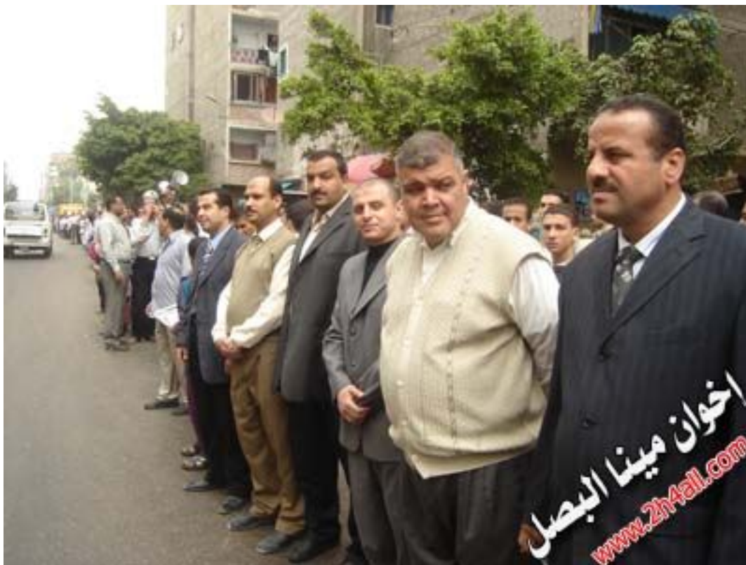
... et manifestation de Frères musulmans à Alexandrie.